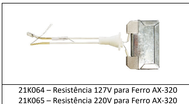
21K064 – Resistência 127V para Ferro AX-320 21K065 – Resistência 220V para Ferro AX-320