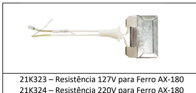
21K323 – Resistência 127V para Ferro AX-180 21K324 – Resistência 220V para Ferro AX-180